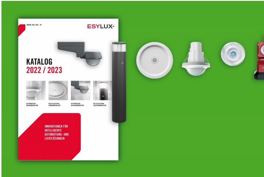
ESYLUX-Katalog 2022 / 2023